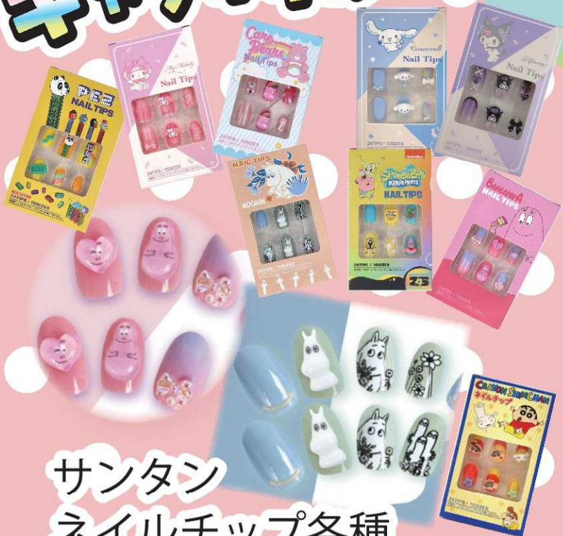
サンタン ネイルチップ各種