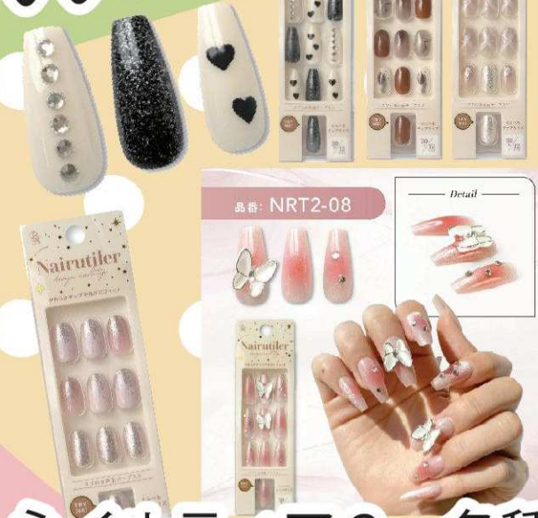
ネイルティア2 各種